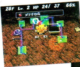
↑真正正銘の1回勝負。セーブによるやり直しはいっさいしていないのだ。