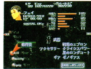
↑フェイのステータス。かなりレベルを高めていることが見受けられる画面だ。